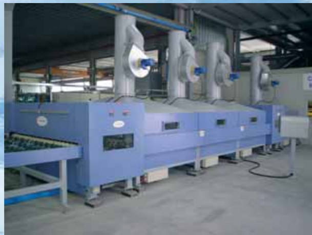
⑥/⑦ Mangano/Pressing section/ Calandra/Calandre/ Mangel/Calandra