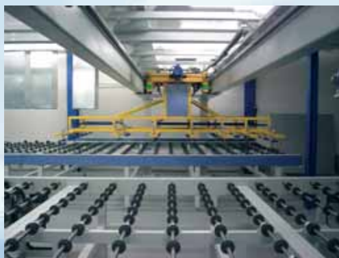
③ Zona trasferimento e accoppiamento/ Transferring and assembling section/ Zona de transferencia y acoplamiento/ Zone translation et accouplement/ Transfer- und Zusammensetzungs-Bereich/ Zona transferência acoplamento