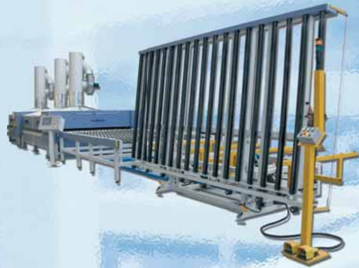
①/⑧ Tavolo ribaltabile di carico-scarico/ Loading-unloading tilting table/ Mesa basculante de carga-descarga/ Table basculant de charge-décharge/ Kippbarer Be Entlade -Tisch/ Mesa giratória de carregamento e descarregamento