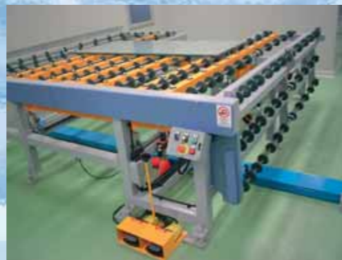
⑤ Tavolo di rifilatura pneumatico per vetri piccoli/ Trimming system for small glass with pneumatic table/ Mesa de recorte neumática para vidrios pequeños/ Table d'ébarbage pneumatique pour verres petits/ Pneumatischer Beschnitt-Tisch für kleine Glasscheiben/ Mesa pneumática para corte das extremidades para vidros pequenos