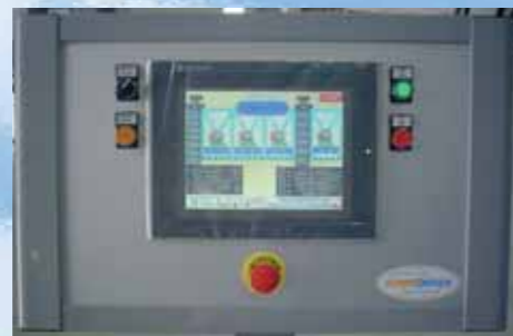
⑨ Pannello di controllo/Control panel/ Panel de control/Panneau de control/ Schalttafel/Painél de controle