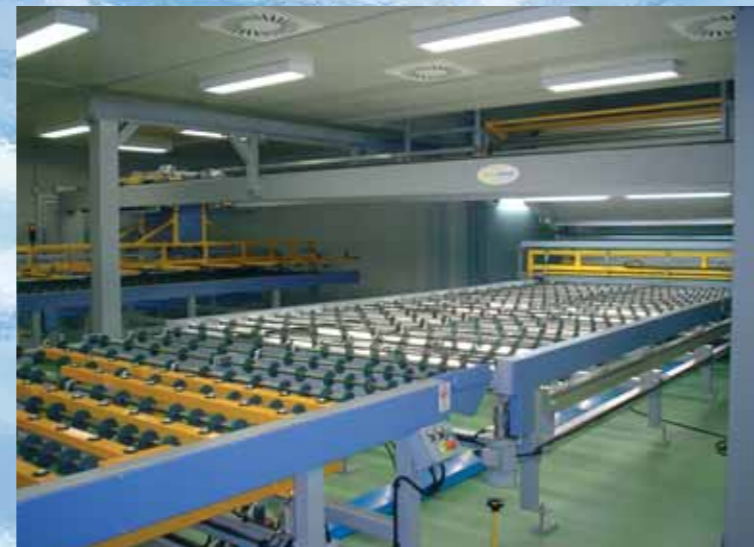
③ Zona trasferimento e accoppiamento/ Transferring and assembling section/ Zona de transferencia y acoplamiento/ Zone translation et accouplement/ Transfer- und Zusammensetzungs-Bereich/ Zona transferencia acoplamiento