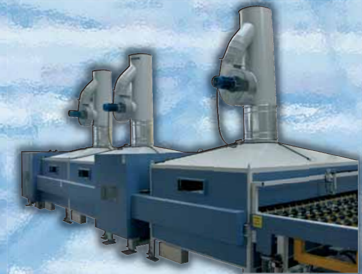
⑥/⑦ Zona riscaldamento e pressatura/ Heating and pressing section/ Zona calentamiento y prensado/ Zone chauffage et pressage/ Heiz- und Pressungs-Bereich/ Zona aquecimento e prensagem