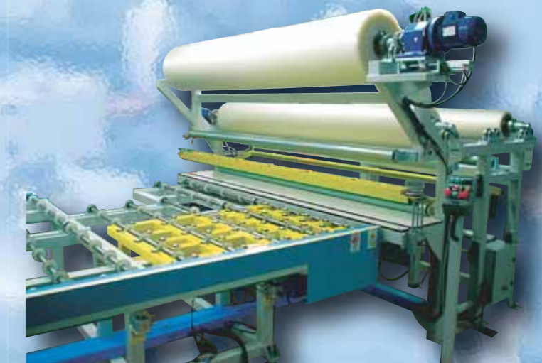
④ Zona svolgimento PVB e rifilatura/ Unwinding PVB and trimming section/ Zona de aplicación del PVB y recorte/ Zone déroulement du PVB et ébarbage/ Folienabwicklungs- und Beschnitt -Bereich/ Zona de desenrolamento PVB e corte das extremidades